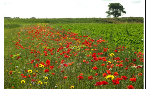
Ook (weer) in Ermelo ?