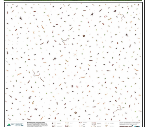
Poster van Universiteit Wageningen Op 1 m 2 goede grond leven meer dan 550 beestjes. Op de 1m 2 grote poster zijn de 550 beestjes ingetekend.