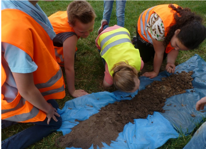
bodemonderzoek bij Het Verloren Veld

In oktober 2017 gaan de leerlingen van groep 7 van de Goede Herderschool weer een ontdekkende tocht maken door het weidegebied van Horst en Telgt. Tijdens deze tocht per fiets maken zij nader kennis met hun eigen woon- en leefomgeving met onder andere bodemonderzoek in de nabijheid van boerderij het Verloren Veld en het Riebroeksepad; aandacht voor de herkomst en het doel van het sluisje bij boerderij De Boshof; het kampenlandschap en de houtsingels van Groenewoud en de watertjes aan de Zandkampweg en de Arendlaan.