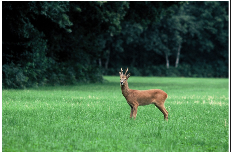
reebok 6 ender

Wilt u getuige zijn van de bronst, dan raad ik u aan om bij voorkeur 's morgens vroeg of in de avondschemering rustig tegen de wind en met gedekte kleuren (kleding) te gaan zitten aan de rand van een weiland in een gebied waar reewild voorkomt. Dit kunt u zelf al ontdekken door te letten op prenten (hoefafdrukken), veeg- en krabplaatsen en wissels, vaste paden dat het reewild neemt van voedsel naar rustgebied.